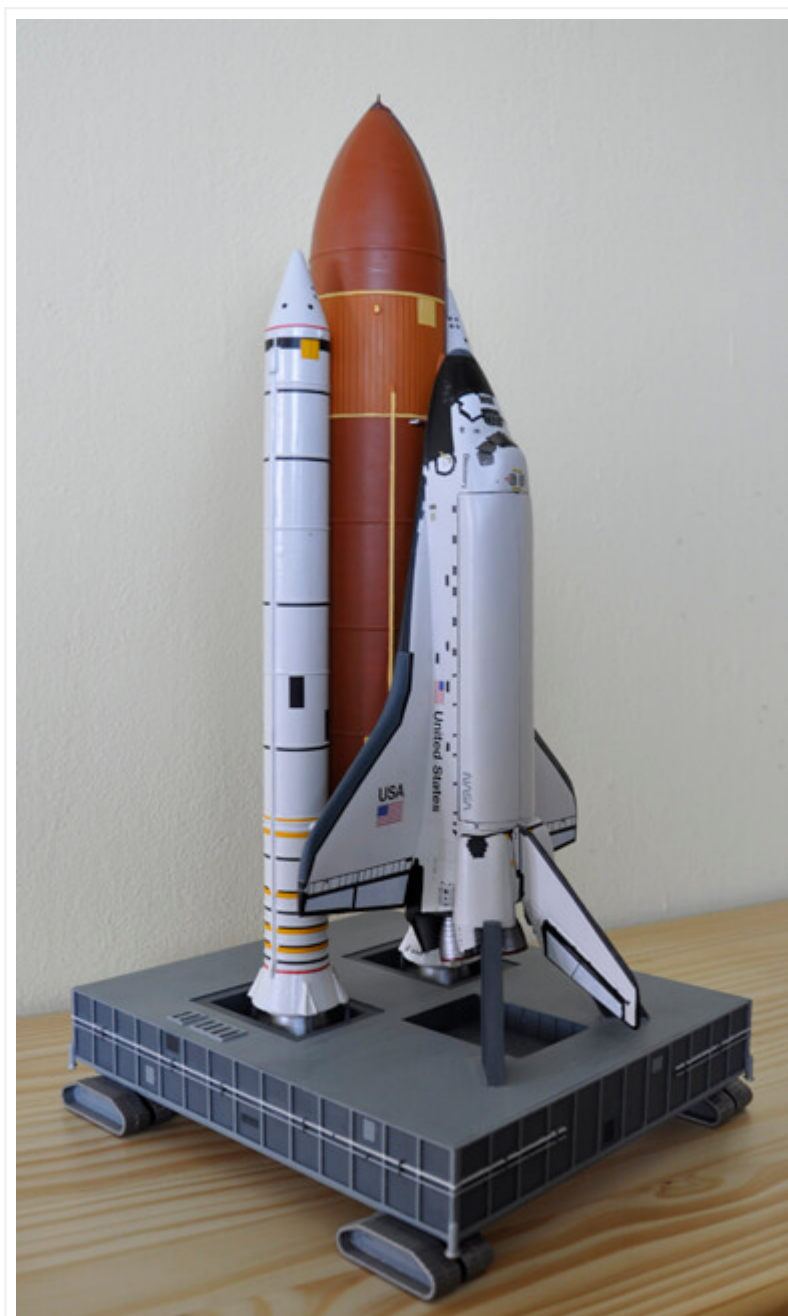
Ovaj šatl je u orbitu postavio teleskom Hابل i izveo nekoliko kasnijih servisnih misija na ovom teleskopu.