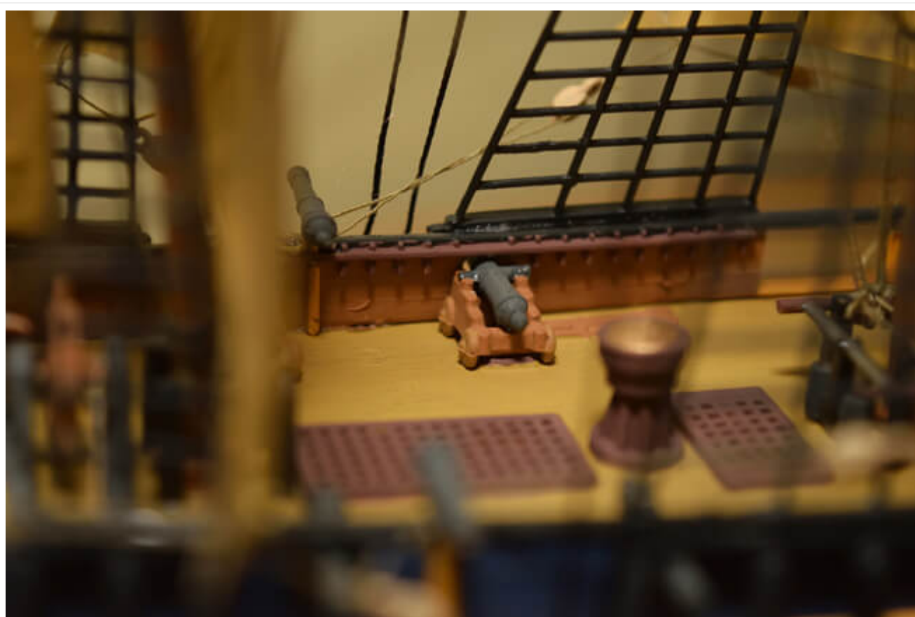
Kako brod nije sačuvan, njegov izgled je rekonstruisan sa crteža koji su napravljeni prilikom odlaska na put.