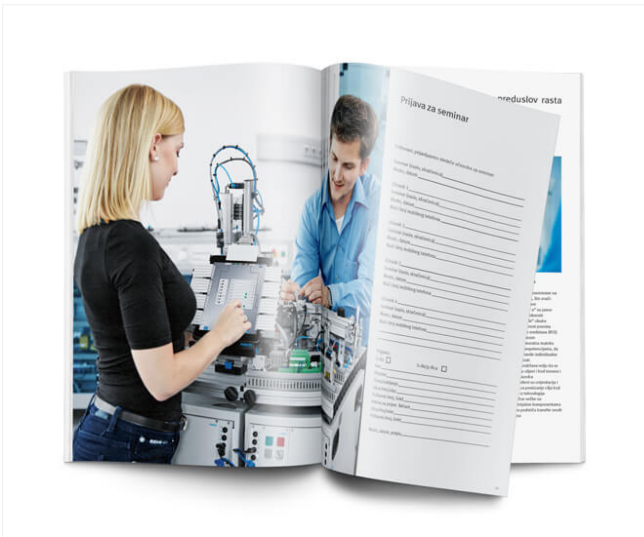
Dok su neka od rešenja potpuno nova, ali u skladu sa korporativnim identitetom, što je obezbedilo uniformnost grafičkog dizajna i vrhunski grafički kvalitet same brošure.