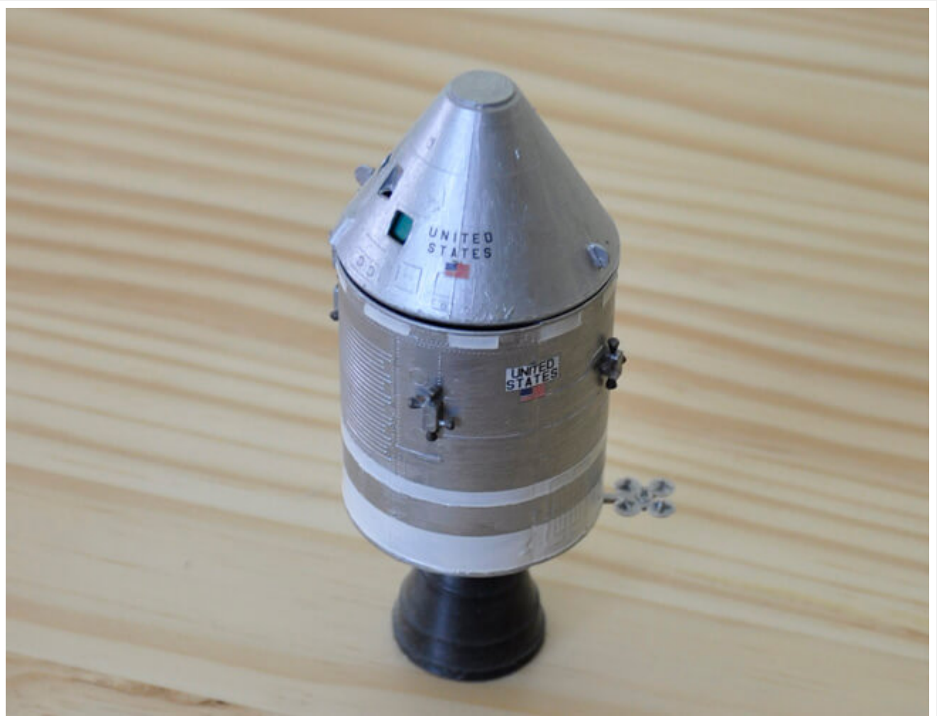
Majkl Kolins je ostao u drugom modulu koji je ostao u Mesečevoj orbiti i kojim su se nakon misije vratili na Zemlju.